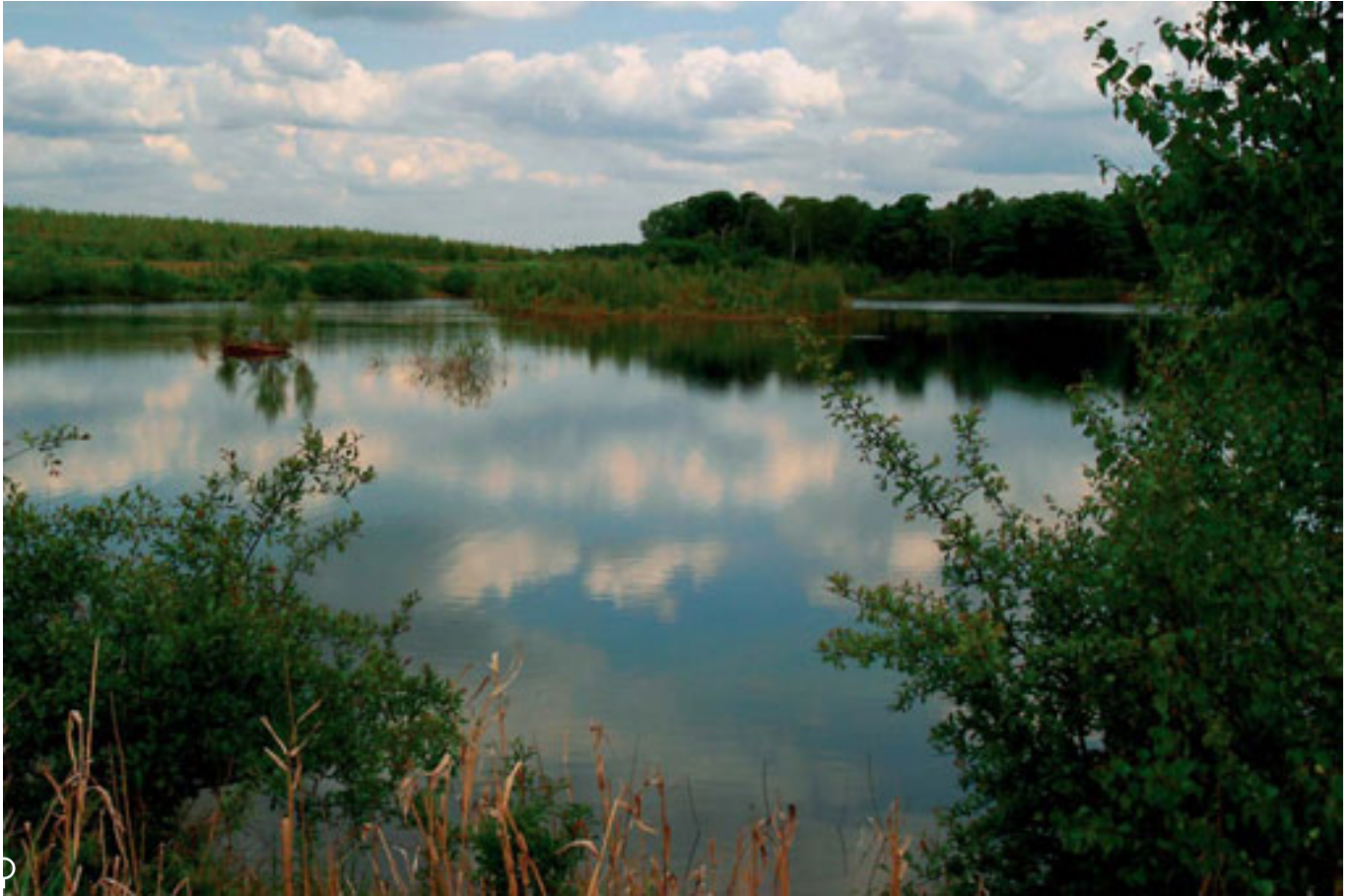
LA RESERVA NATURAL de Moore, gestionada por WRG, es parte de la fase de restauración del vertedero de Arpley. Se compone de unas 80 hectáreas de bosques, praderas, lagos y charcas. Está considerada como una zona importante de conservación en el noroeste de Inglaterra. En la página de la izquierda, foto aérea del vertedero de Arpley.