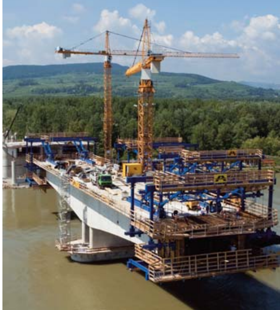
Construcción del puente Traismauer sobre el Danubio (Baja Austria).