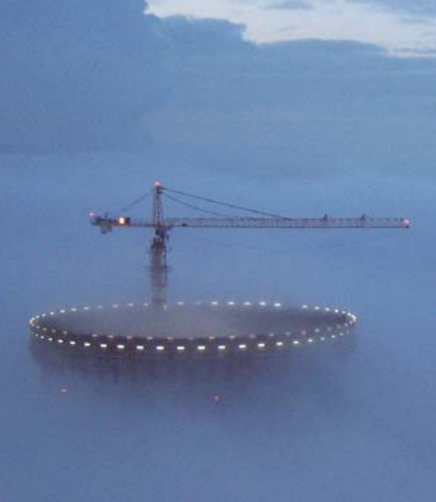
Torres de refrigeración de la central eléctrica de Neurath (Alemania).