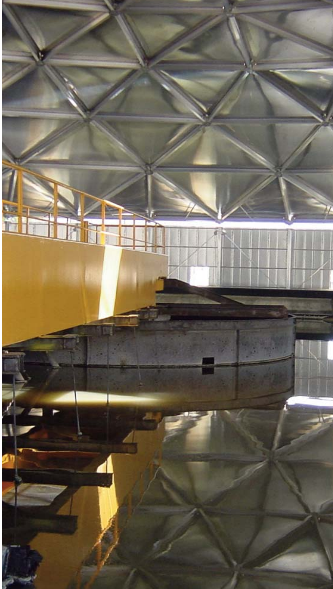
Estación depuradora de aguas residuales de Casaquemada, en San Fernando de Henares (Madrid), construida por FCC.

En España, Aqualia tiene un 34% de cuota del mercado de gestión indirecta del agua. Presta servicio a más de 800 municipios y atiende a una población superior a los 13 millones de habitantes. En 2007, fue elegida como la Mejor Compañía de Gestión del Agua del año en todo el mundo por la prestigiosa revista internacional Global Water Intelligence, un reconocimiento que premia su evolución en los últimos años y su trayectoria internacional. A este galardón se suma el Premio Customer Service Leadership of the Year (Liderazgo en el Servicio al Cliente), otorgado por la prestigiosa consultora británica Frost & Sullivan.