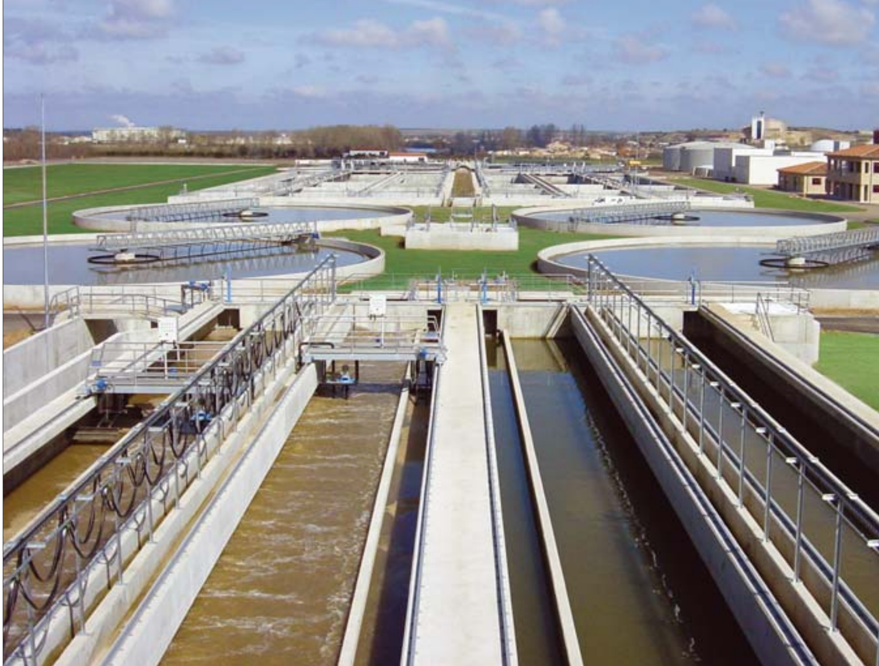
Estación depuradora de aguas residuales de Salamanca.

cada vez menos ruidosos y emitan menos gases contaminantes a la atmósfera.