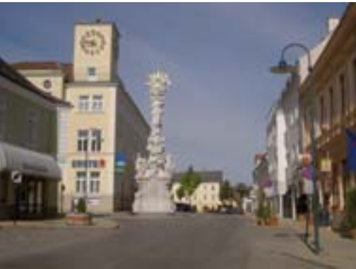
Sobre estas líneas, imágenes de la ciudad de Zistersdorf.

Entre ellos destaca la recogida y tratamiento de residuos municipales de AWW Graz- Umgebung, por un período de cinco años y una facturación anual de 2,1 millones de euros; el contrato de tratamiento de aguas residuales con SMVAK (Republica Checa), por tres años con una facturación anual de un millón de euros; el proyecto de recuperación de suelos contaminados Kamenolom (Srdce), en Eslovaquia, por un período de dos años y una facturación anual de 10 millones de euros; la recogida municipal y limpieza viaria para un distrito de la ciudad de Sofía, por dos años, y el de la limpieza viaria y servicios de invierno de Pleven I, con una duración de 10 años y una facturación de 700.000 euros/año.