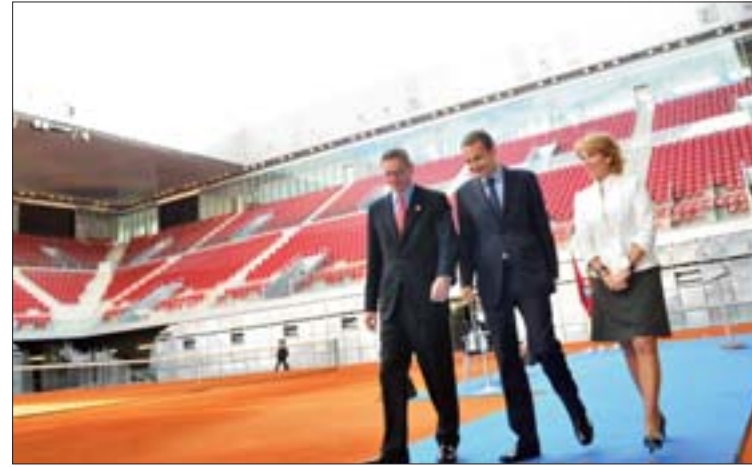
Sobre estas líneas, el Alcalde de la capital, Alberto Ruiz-Gallardón, acompañado del Presidente del Gobierno, José Luis Rodríguez Zapatero, y de la Presidenta de la Comunidad Autónoma de Madrid, Esperanza Aguirre. Abajo, Alberto Ruiz-Gallardón durante el acto de inauguración.

El segundo, el Tennis Indoor, incluye 11 pistas cubiertas y es un edificio polivalente con club deportivo, gimnasio, spa, restaurante y zona administrativa. A todas las instalaciones hay que